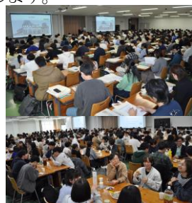
令和7年度新入生オリエンテーション(上)と祝賀会(下)(4月3日)